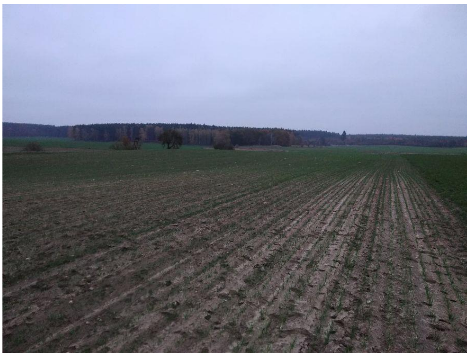
(Widok z działki na południowy zachód)