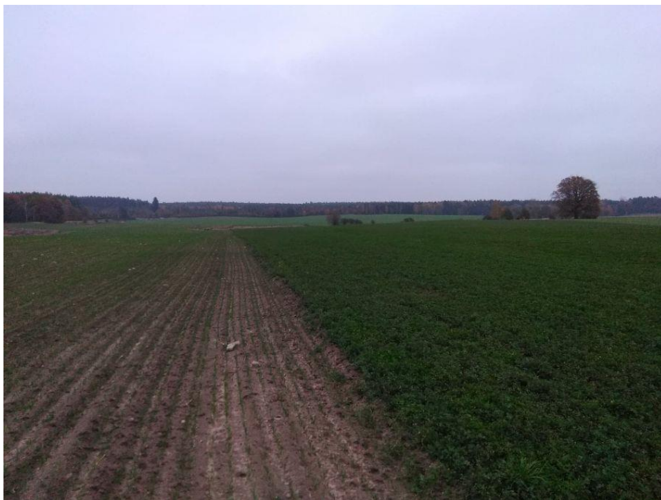
(Widok z działki na południowy zachód)