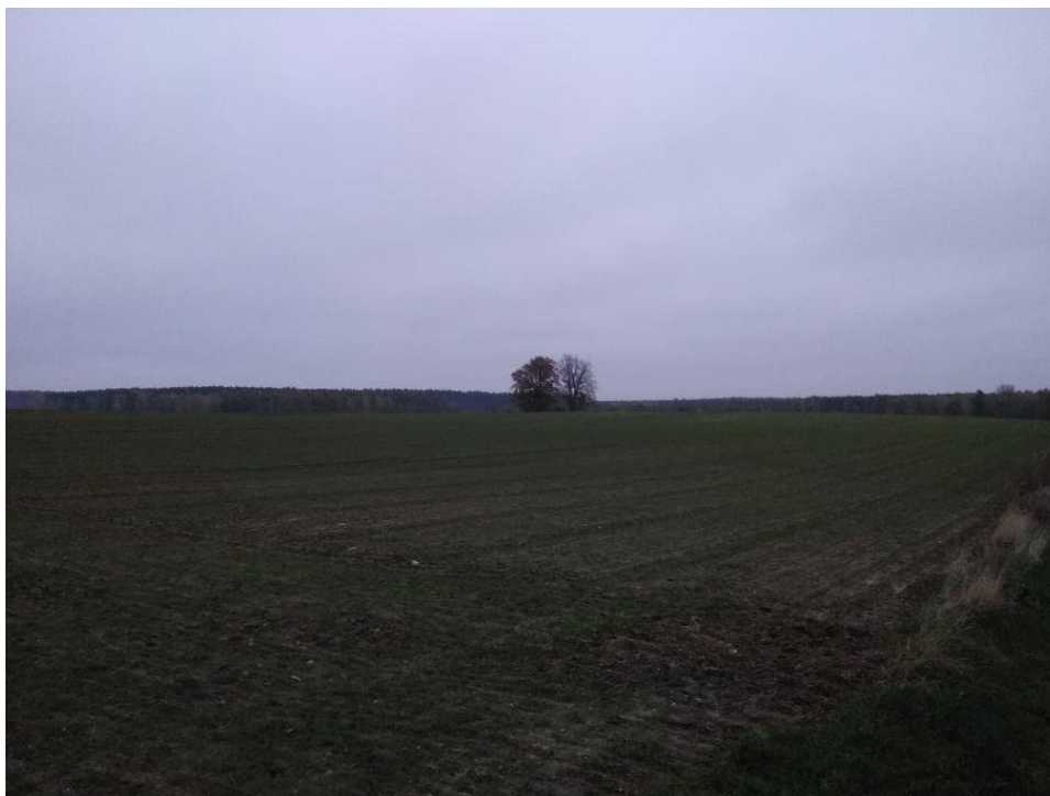
(Widok z działki na południe)

Po wykonaniu instalacji w czasie eksploatacji elektrowni słonecznej teren biologicznie czynny zostanie zachowany w dobrej kulturze rolnej tzn. planuje się zasianie trawy, która będzie koszona i usuwana co najmniej raz w roku. Na obszarze inwestycji nie planuje się wykonania fundamentów pod konstrukcje paneli fotowoltaicznych przez co profil gruntu pozostanie bez zmian. Ze względu na swoją charakterystykę inwestycja w żaden sposób nie wpłynie na stan prawny i faktyczny przyległych nieruchomości – ich właściciele będą mogli dalej je wykorzystywać według własnego uznania.